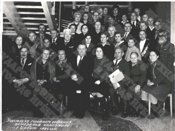
Участники городского собрания ветеранов комсомола г. Ирбит 1984 год.